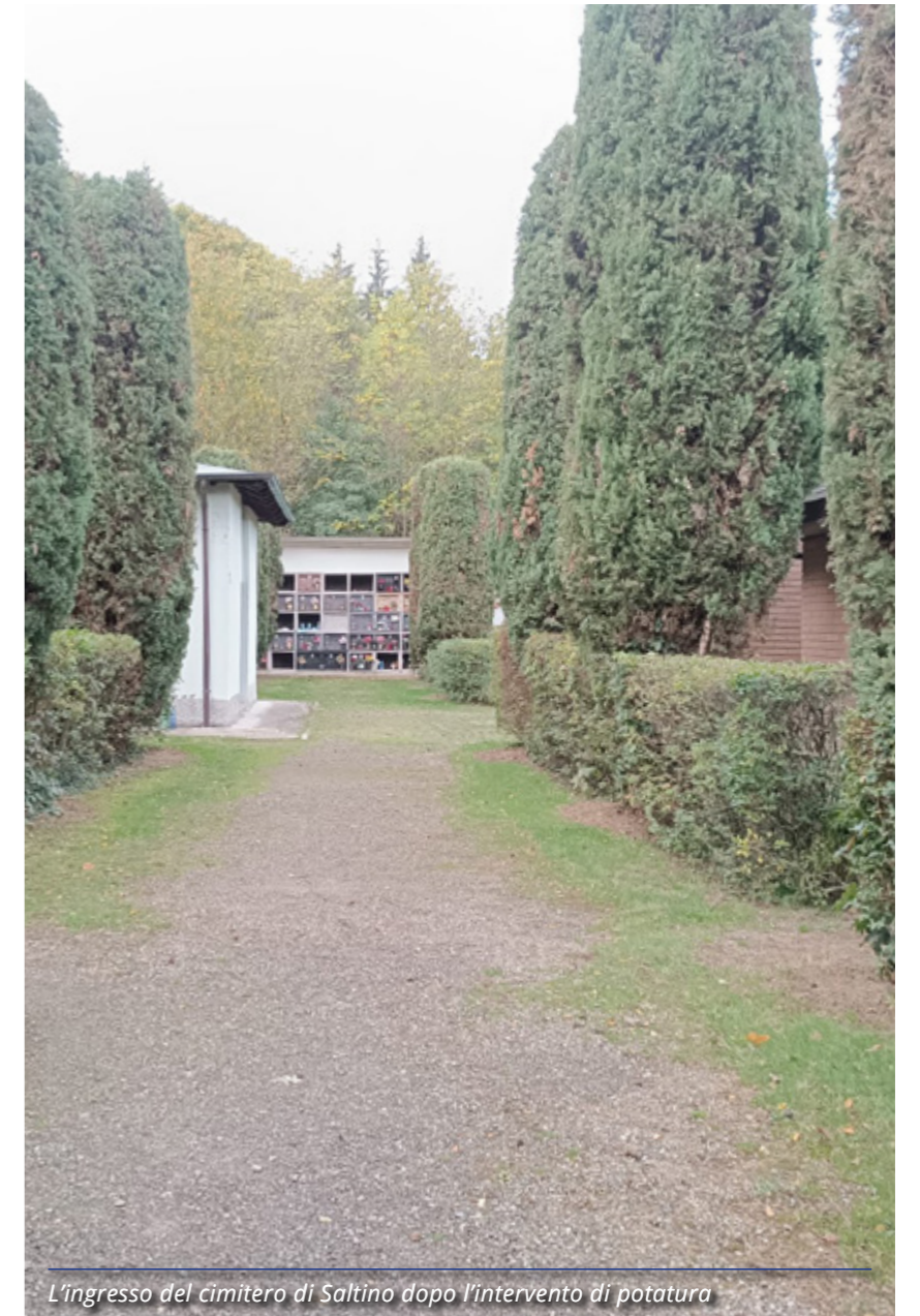
L'ingresso del cimitero di Saltino dopo l'intervento di potatura

Grazie a un finanziamento di 23.966 euro del fondo concorsi "Progettazione e idee per la coesione territoriale" della Presidenza del Consiglio dei Ministri, è stato redatto un progetto per il recupero