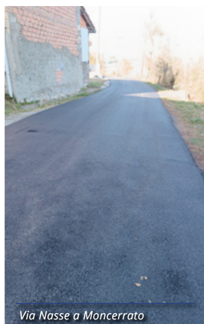
Via Nasse a Moncerrato