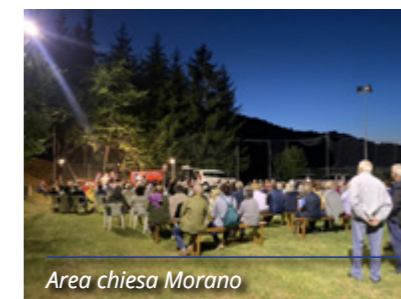
Area chiesa Morano