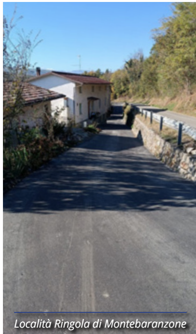
Località Ringola di Montebaranzone