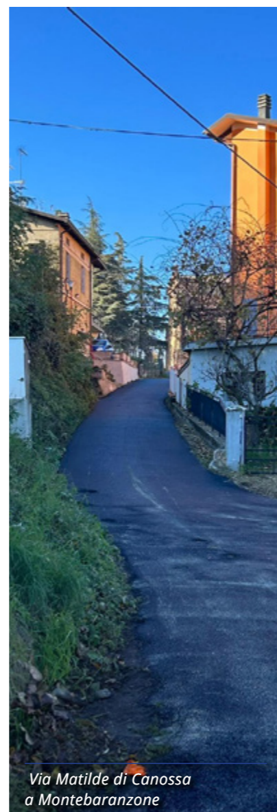
Via Matilde di Canossa a Montebارانzone