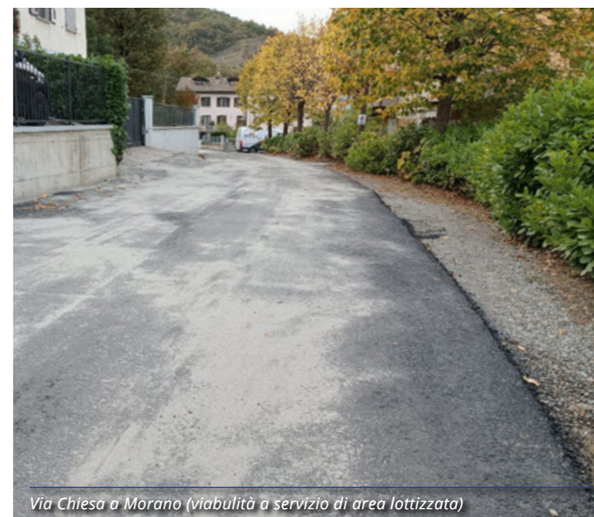
Via Chiesa a Morano (viabilità a servizio di area lottizzata)