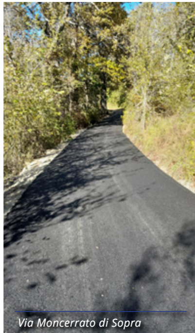
Via Moncerrato di Sopra