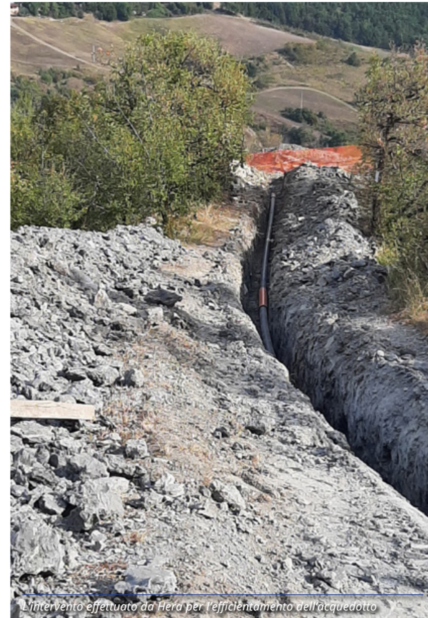
L'intervento effettuato da Hera per l'efficiamento dell'acquedotto

Il Gruppo Hera sta effettuando interventi finalizzati a garantire maggiore disponibilità di acqua alle zone collinari e appenniniche durante i periodi di siccità. Il primo stralcio di lavori ha riguardato la rete acquedottistica di Prignano, con un investimento di circa 360.000 euro . Nello specifico, si sta provvedendo alla posa di una nuova tubazione in acciaio