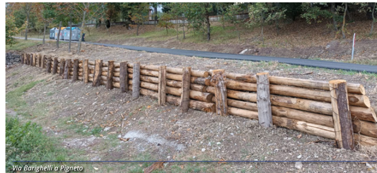
Via Barighelli a Pigneto