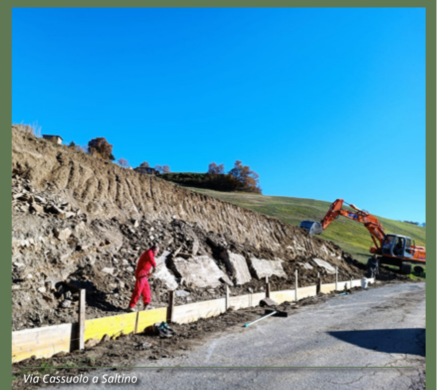
Via Cassuolo a Saltino