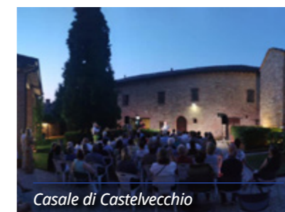
Casale di Castelvecchio