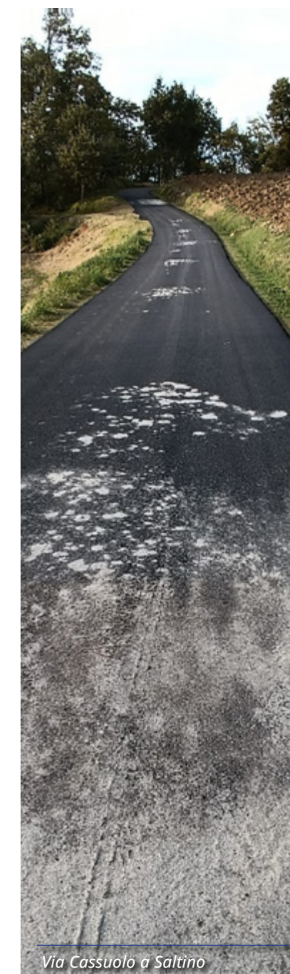
Via Cassuolo a Saltino