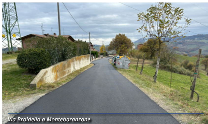
Via Braidella a Montebارانzone