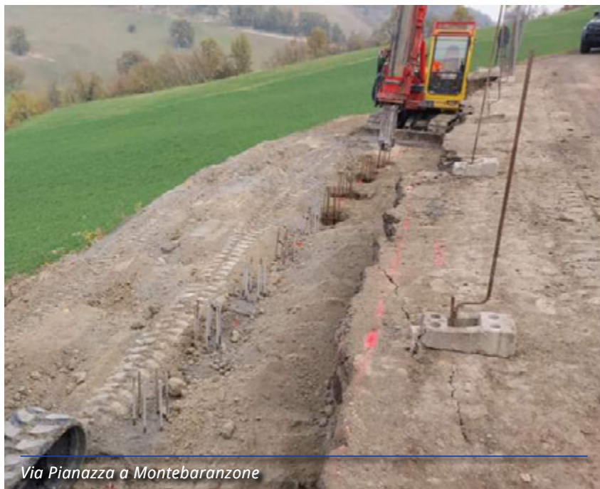
Via Pianazza a Montebaranzone