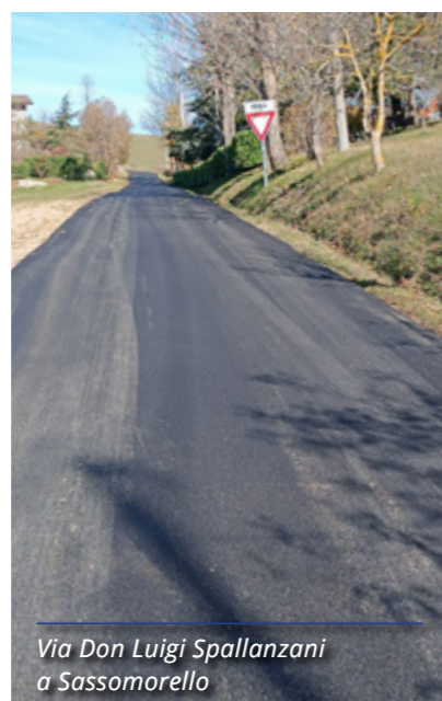
Via Don Luigi Spallanzani a Sassomorello