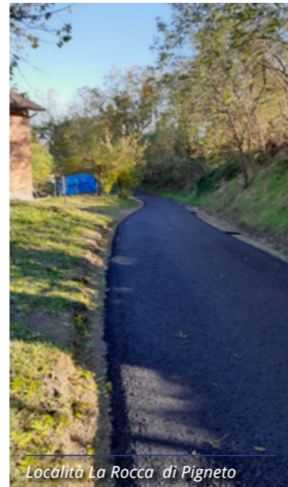
Località La Rocca di Pigneto