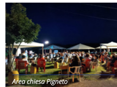
Area chiesa Pigneto