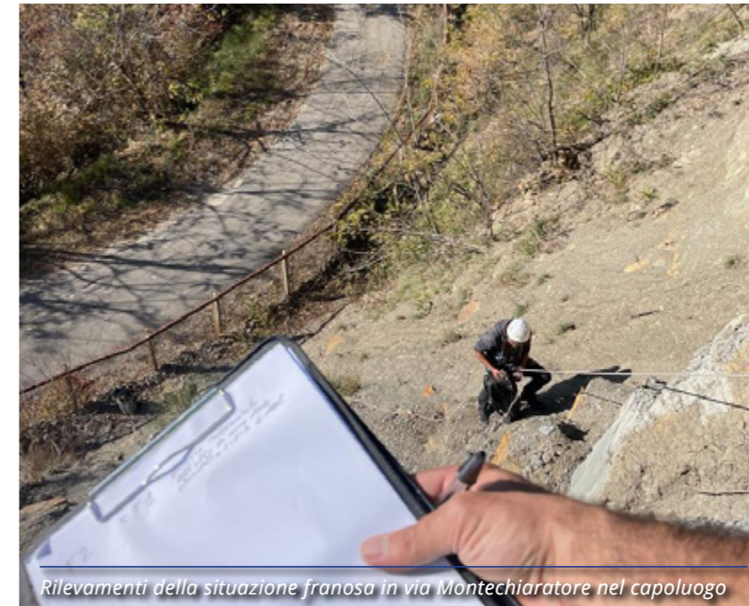
Rilevamenti della situazione franosa in via Montechiaratore nel capoluogo