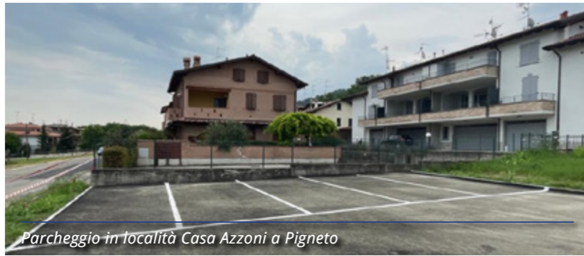
Parcheggio in località Casa Azzoni a Pigneto